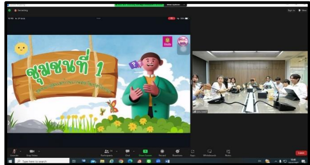
ภาพบรรยากาศพิธีเปิดโครงการ