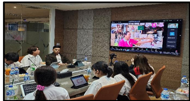
ภาพการนำเสนอผลโครงการ ทีม สุดละมุนกับคุณผู้ชาย เมื่อวันที่ 12 ตุลาคม 2567