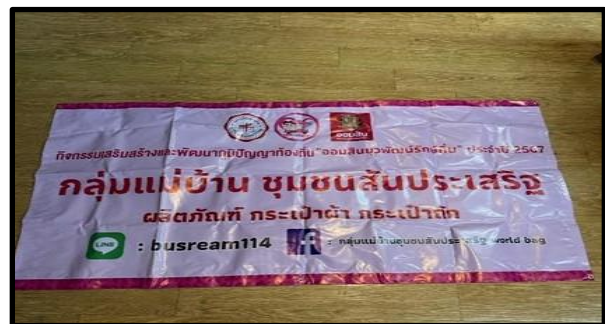
ภาพไวนิล