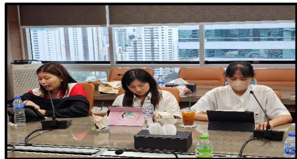
ภาพการนำเสนอผลโครงการ ทีม เก่งเกินร้อยสาวน้อยร้อยกระเป๋า เมื่อวันที่ 12 ตุลาคม 2567