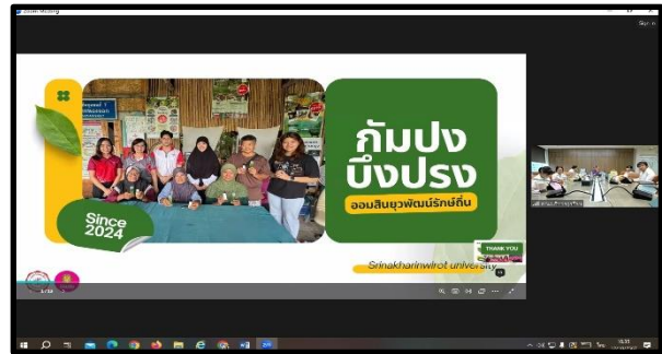
ภาพการนำเสนอผลโครงการ ทีม ไก่มาได้หมับ เมื่อวันที่ 12 ตุลาคม 2567