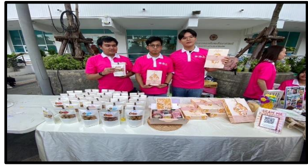
ภาพการออกบูธจำหน่ายสินค้า ทีม เก่งเกินร้อยสาวน้อยร้อยกระเป๋