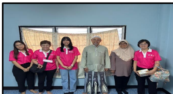
ภาพผู้นำชุมชน