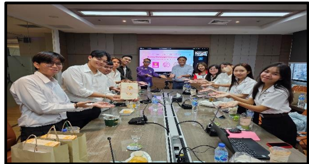
ภาพบรรยากาศพิธีปิดโครงการ