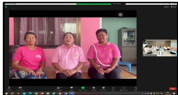
ภาพการนำเสนอผลโครงการ ทีม ปวดไตใช้หม่องจิ เมื่อวันที่ 12 ตุลาคม 2567