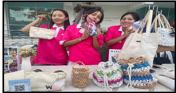
ภาพการออกบูธจำหน่ายสินค้า ทีม สุดละมุนกับคุณผู้ชาย